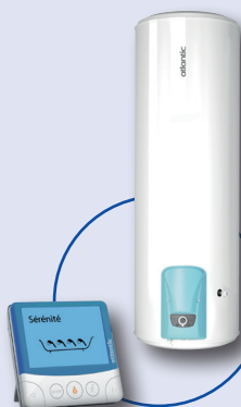
Vizengo Chauffe-eau électrique avec protection dynamique par ACI Hybride

Détecteur/Contacteur J/N pour piloter votre chauffe-eau pendant les meilleures périodes tarifaires.